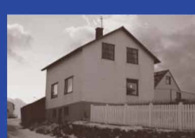
Skólastígur 8 Byggingarár 1922 Yfirmiður: Árni Snæbjarna- son Byggt fyrir Árna Snæbjarna- son Verslun- Íbúðarhús