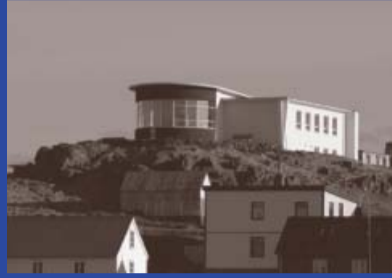
Bókhöðustíg 19 Byggingarár 1961 Arkitekt: Peter Matull Byggt fyrir Sýslu- nefnd Snæfellinga og Hnappdæla Bókasafn