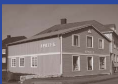
Hafnargötu 1 Byggingarár 1876 Yfirmiður: Sigurður Eiríksson Byggt fyrir Clausensverslun Verslunarhús, Apótek & Íbúðarhús