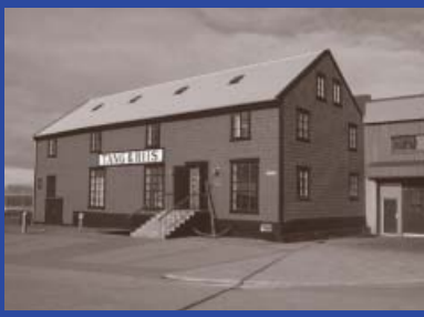
Aðalgata 1 Byggingarár 1890 Yfirmiður: Sveinn Jónson Byggt fyrir Gramsverslun Pakkhús-Verslun, skrifstofur