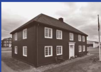
Hafnargata 5 Byggingarár 1832 Yfirmiður: Jón Hjaltalín Byggt fyrir Árna Thorlacius Íbúðarhús Verslun Byggðasafn