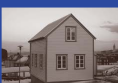
Skólastígur 5 Byggingarár 1895 Byggt fyrir Ágúst Pórarinsson Íbúðarhús