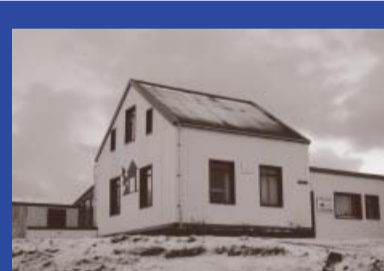
Höfðagata 1 Byggingarár 1896 Byggt fyrir Stykkis- hólmshrepp Barnaskóli Bakarí Farfuglaheimili