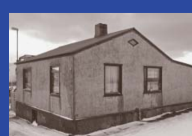
Bóklöðustíg 17 Byggingarár 1907 Byggt fyrir Odd Valentínsson Íbúðarhús