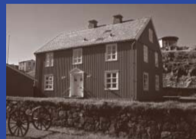
Skólastíg 1 Byggingarár 1874 Yfirmiður: Sigurður Eiríksson Byggt fyrir Clausensverslun Íbúðarhús