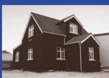
Höfðagata 3 Byggingarár 1874 Íbúðarhús