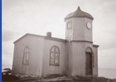
30 Gamla Bókasafnið