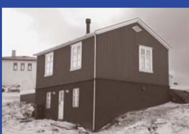
Höfðagata 2 Byggingarár 1907 Íbúðarhús