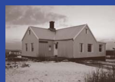
Bóklöðustígur 9 Byggingarár 1903 Byggt fyrir Guðmund Halldórsson Íbúðarhús