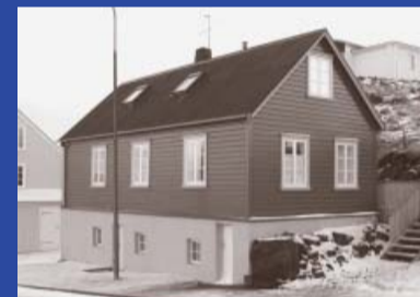
Hafnargata 13 Byggingarár 1905 Byggt fyrir Lárus Knudsen Íbúðarhús