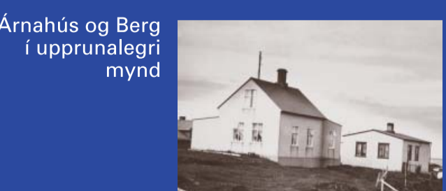
Árnahús og Berg í upprunalegrí mynd