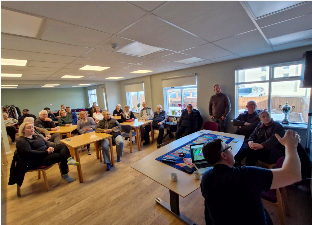
Íbúafundur fór fram á Höfðaborg.

Bæjarstjórn Stykkishólms skipaði, á 24. fundi sínum, starfshóp um mótun stefnu sveitarfélagsins í íþróttamálum. Hlutverk hópsins m.a. að móta framtíðarsýn um fjölbreytt íþrótt- og tómskundastarf fyrir íbúa á öllum aldri, bæði innan- og utandyra. Þá var starfshópnum falið að leggja fram tillögur að uppbyggingu íþróttatengdra mannvirkja í