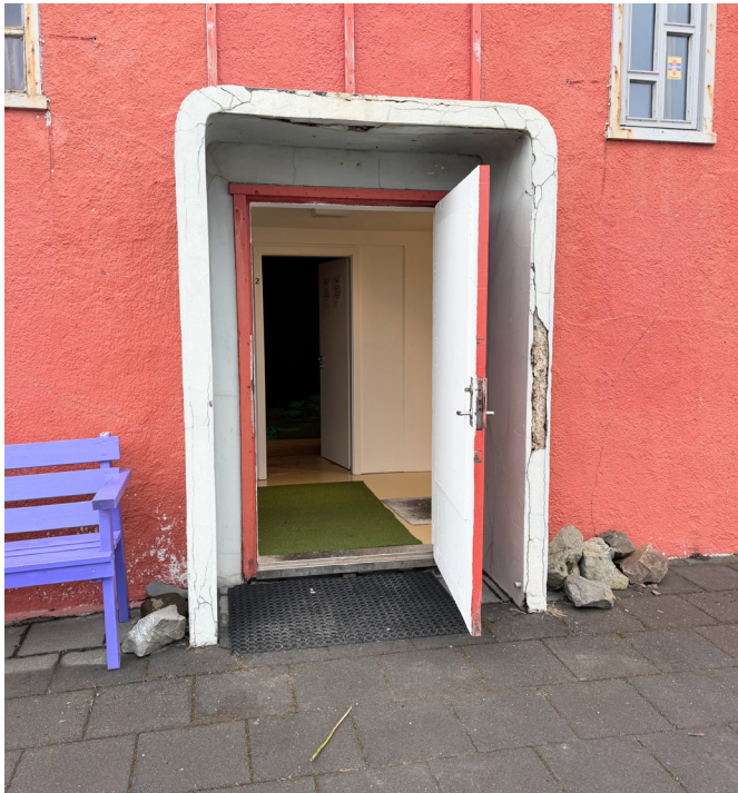
Búið er að hressa töluvert upp á húsnæðið að innan.

við hæfi. Aftanskin stefnir að því að halda opið hús á næstunni þar sem íbúum og öðrum gestum gefst kostur á að kynna sér starfsemina og sjá þær breytingar sem orðið hafa á húsinu.