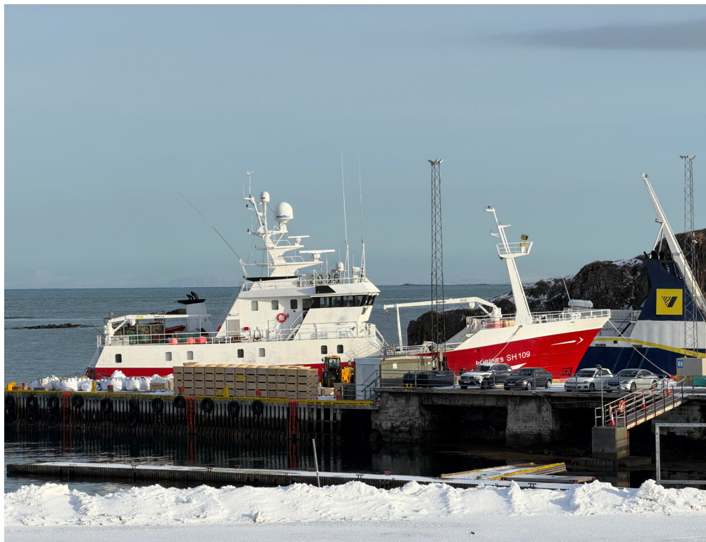
Þórsnes við höfn í Stykkishólmi.

Bæjarstjórn Stykkishólms hefur lýst yfir þungum áhyggjum af fyrirliggjandi frumvarpi innviðaráðherra þar sem lagt er til að fella niður skelbætur. Bæjarstjórn leggst eindregið og hart gegn frumvarpinu og skorar á ríkisstjórn og Alþingi að falla frá því í núverandi mynd.