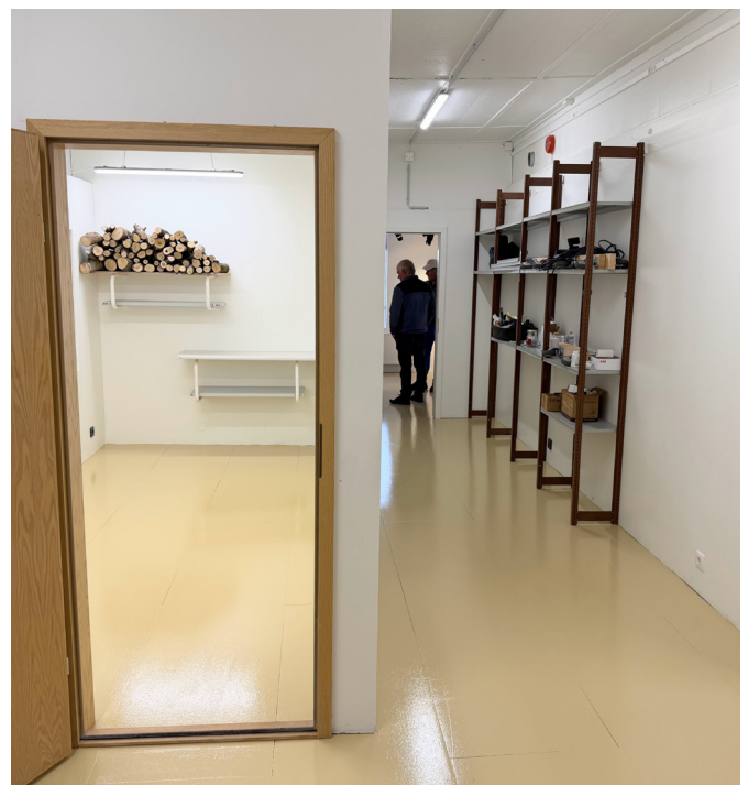
Búið er að útbúa sér herbergi fyrir rennibekk.