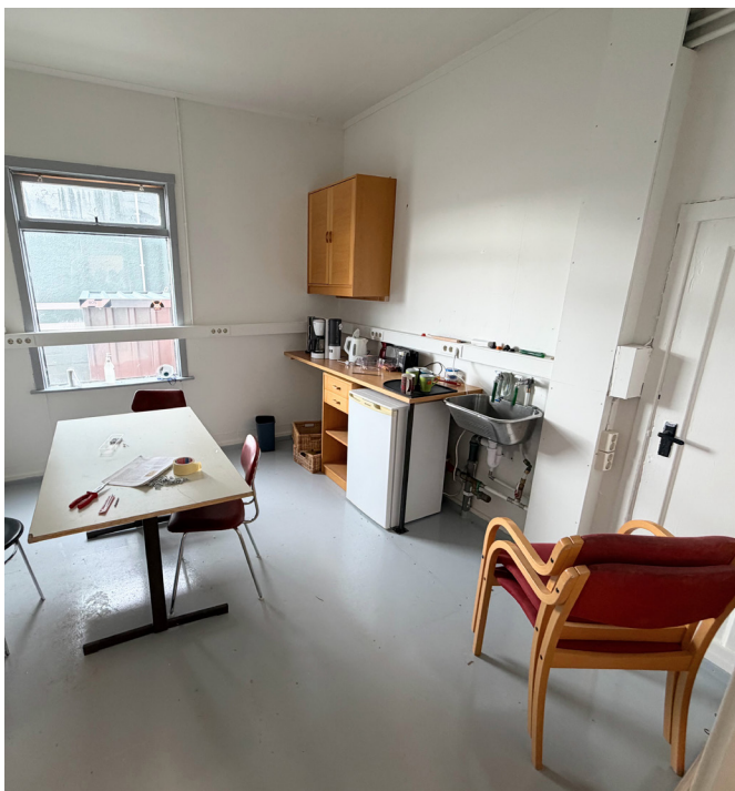
Kaffistofan er í vinnslu.