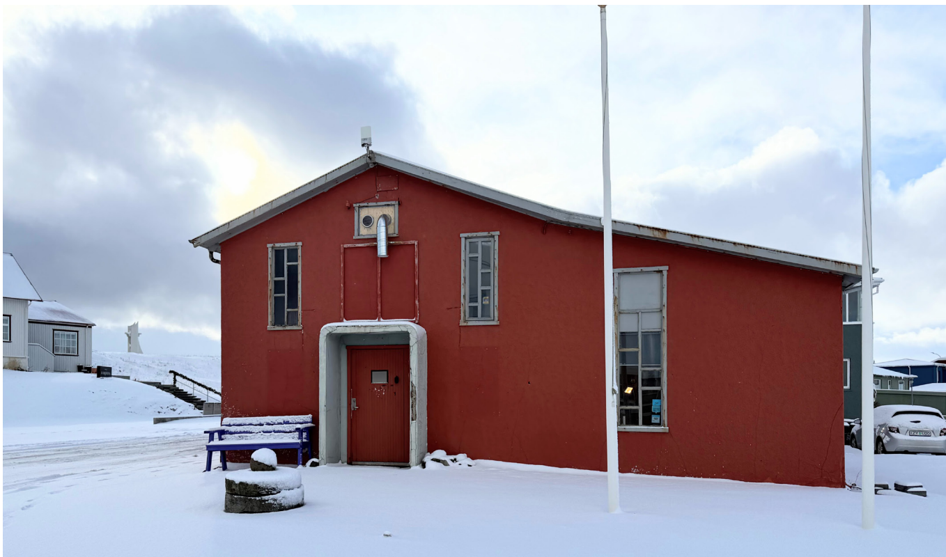
Samkomuhúsið í Stykkishólmi.

Nýverið var greint frá samningi sveitarfélagsins og Aftanskin um notkun á Samkomuhúsinu í Stykkishólmi. Bæjarstjórn samþykkti samninginn með því skilyrði að óháð og fagleg úttekt færi fram og staðfest yrði að loftgæði í húsnæðinu væru fullnægjandi en ekki heilsuspillandi.