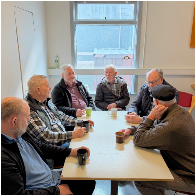
Strákarnir fara yfir málin yfir kaffibolla.

Aftanskin, félag eldri borgara í Stykkishólmi, bauð gestum og gangandi í opið hús í Samkomuhúsinu í Stykkishólmi þann 16. apríl síðastliðinn.