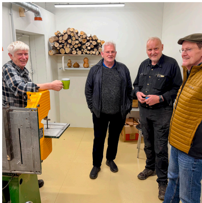
Rennibekkurinn dró þessa að sér.

Í Samkomuhúsinu hafa nú verið settir upp milliveggir til að skilja á milli rýma. Búið er að