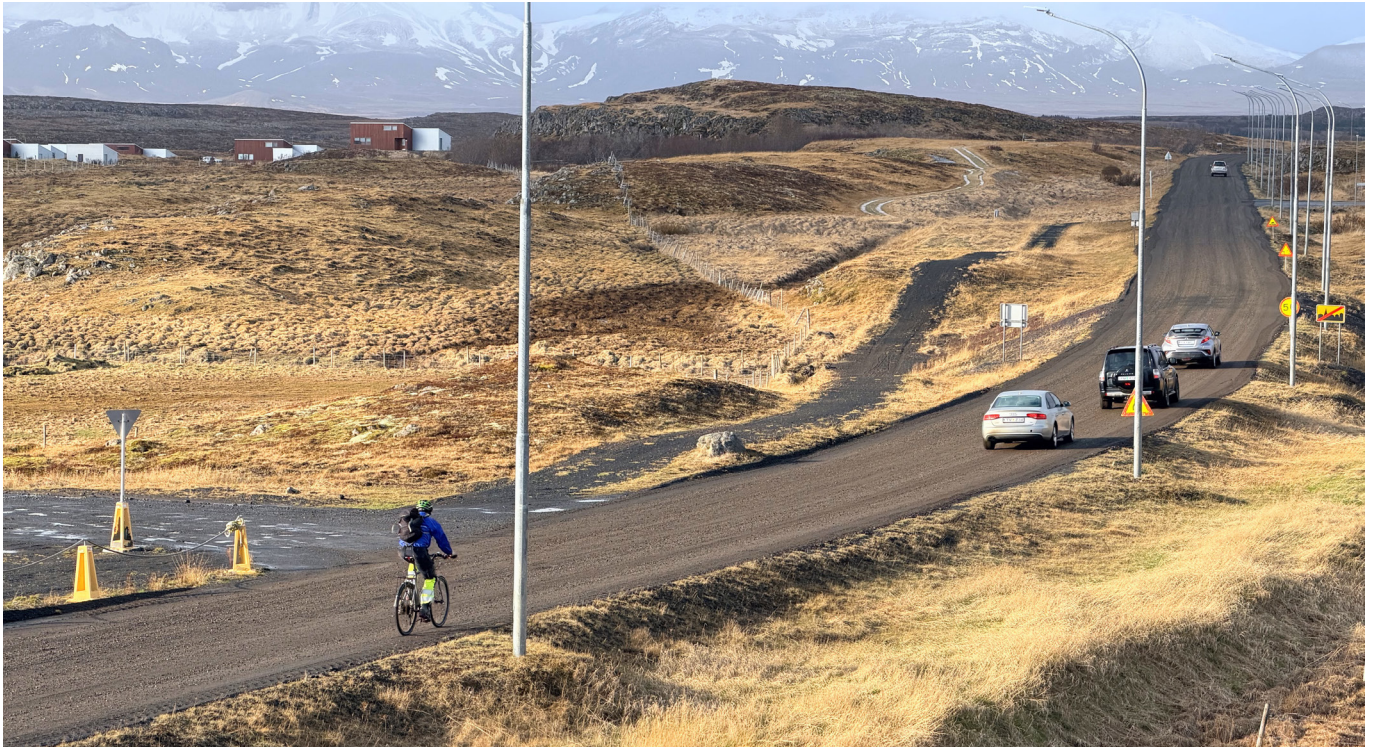
Vegfarendur á mölinni uppúr bænum.

Framkvæmdir við Stykkishólmsveg eru hafnar. Búið er að fræsa slitlag ofan af veginum frá afleggjara á Búðanesveg og uppúr bænum en nú í sumar verður vegurinn endurbættur og breikkaður fram yfir Þingval-