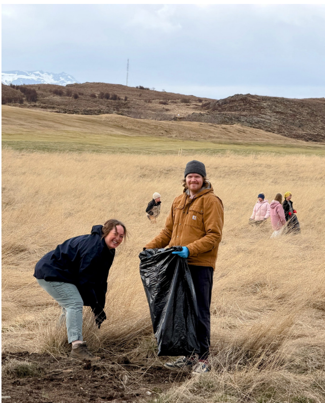
Brosmdirir íbúar leggja sitt af mörkum til samfélagsins.

Stóri plockdagurinn fór svo fram sunnudaginn 26. apríl. Sveitarfélagið stóð fyrir plockviðburði en í ár var áhersla lög á að plocka í Víkurhverfi. Þar hafði víða safnast rusl í skurðum og fjöru. Hreinsun gekk vel og mátti bersýnilega sjá mikinn mun á svæðinu eftir plockið. Góður hópur tók þátt í plockaðgerðum og var að verki loknu var boðið upp á grillaðar pylsur við Kakkelovnholt.